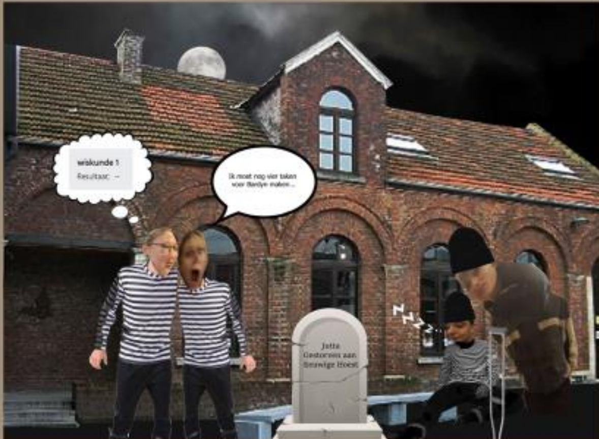
(Dit is hoe we het zeker NIET gaan doen)