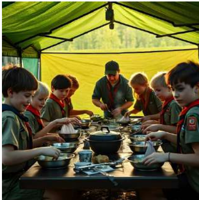
(Afbeelding gemaakt met AI, in het echt is het veel leuker)

Net zoals ieder jaar helpen de jongi's met afwassen op zondag. Uiteraard met de nodige ambiance en gezelschap, hier een kleine voorstelling van hoe het eruit gaat zien: (+nog een leuke meme)